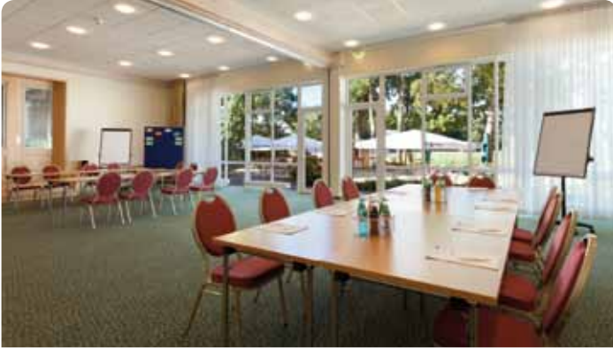
Tagungsräume Mühlenblick 1 und 2

Die angegebenen Pauschalen verstehen sich pro Person und gelten ab einer Teilnehmerzahl von zehn Personen. Die Preise beinhalten das Bedienungsentgelt, Service und die gesetzliche Mehrwertsteuer. Die Größe des Tagungsraumes richtet sich nach der Anzahl der Teilnehmer.