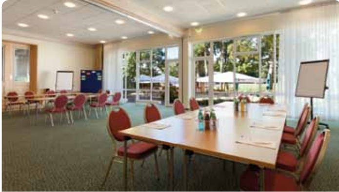
Tagungsräume Mühlenblick 1 und 2

Die angegebenen Pauschalen verstehen sich pro Person und gelten ab einer Teilnehmerzahl von zehn Personen. Die Preise beinhalten das Bedienungsentgelt, Service und die gesetzliche Mehrwertsteuer. Die Größe des Tagungsraumes richtet sich nach der Anzahl der Teilnehmer.