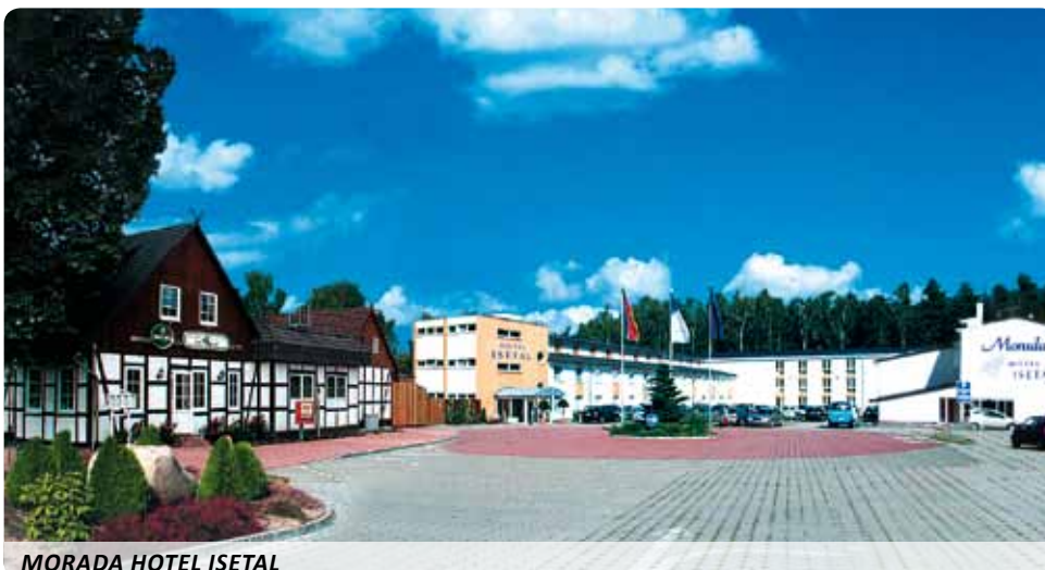
MORADA HOTEL ISETAL

ISE-TOUR (Bootsverleih und überdachte Kahnfahrten), Kinderspielplatz, ISETAL Express, Heide Mollie, Lift (im Haupthaus), 400 kostenfreie PKW-Parkplätze, 4 kostenfreie Busparkplätze