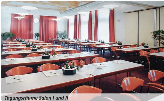
Tagungsräume Salon I und II

Die angegebenen Pauschalen verstehen sich pro Person und gelten ab einer Teilnehmerzahl von zehn Personen. Die Preise beinhalten das Bedienungsentgelt, Service und die gesetzliche Mehrwertsteuer. Die Größe des Tagungsraumes richtet sich nach der Anzahl der Teilnehmer.