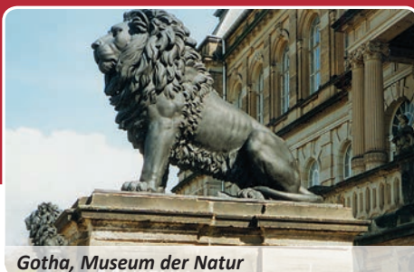
Gotha, Museum der Natur