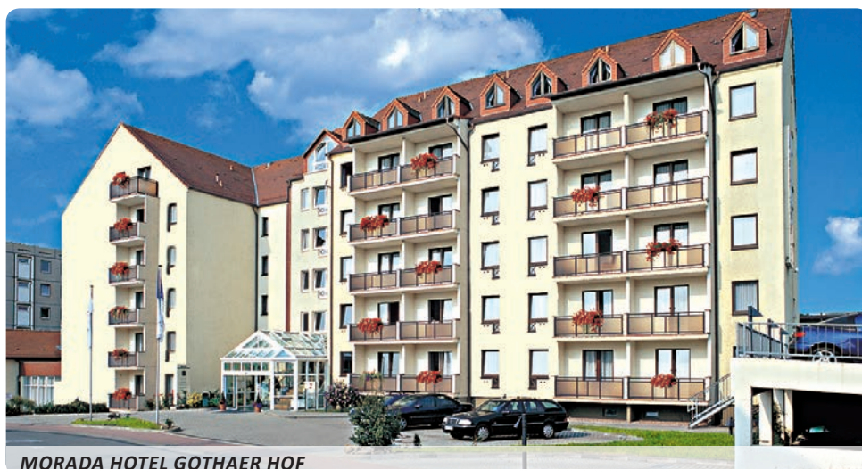
MORADA HOTEL GOTHAER HOF