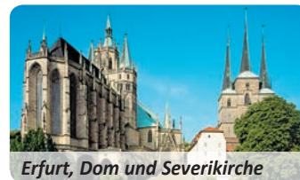
Erfurt, Dom und Severikirche