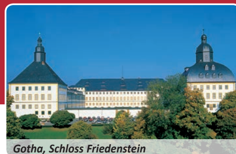
Gotha, Schloss Friedenstein