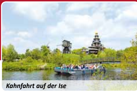
Kahnfahrt auf der Ise