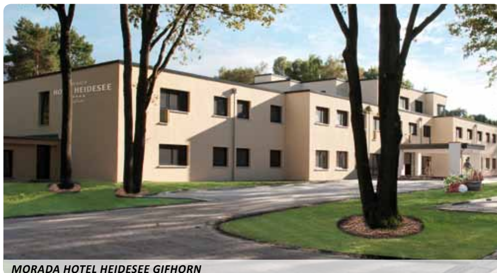
MORADA HOTEL HEIDEESEE GIFHORN