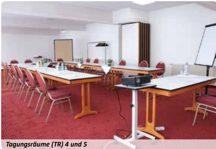
Tagungsräume (TR) 4 und 5