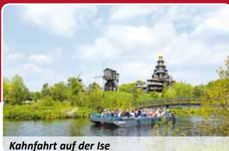
Kahnfahrt auf der Ise