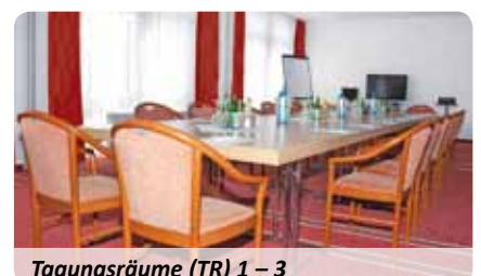
Tagungsräume (TR) 1 – 3