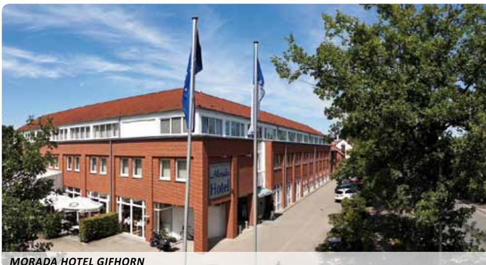
MORADA HOTEL GIFHORN