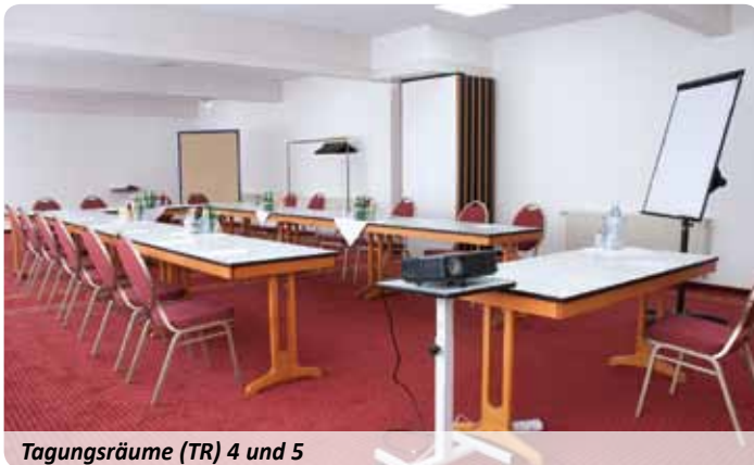
Tagungsräume (TR) 4 und 5