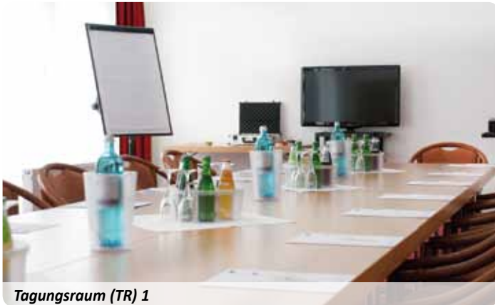
Tagungsraum (TR) 1

Die angegebenen Pauschalen verstehen sich pro Person und gelten ab einer Teilnehmerzahl von zehn Personen. Die Preise beinhalten das Bedienungsentgelt, Service und die gesetzliche Mehrwertsteuer. Die Größe des Tagungsraumes richtet sich nach der Anzahl der Teilnehmer.