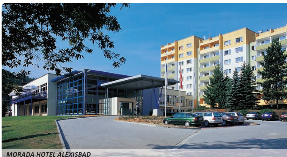
MORADA HOTEL ALEXISBAD

WLAN-Empfang in öffentlichen Hotelbereichen (kostenfrei), TV-Raum, Massage-, Fußpflege- u. Kosmetikstudio, Lift (im Haupthaus), 100 kostenfreie PKW-Parkplätze, 4 kostenfreie Busparkplätze