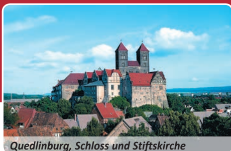
Quedlinburg, Schloss und Stiftskirche