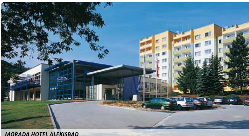
MORADA HOTEL ALEXISBAD

WLAN-Empfang in öffentlichen Hotelbereichen (kostenfrei), TV-Raum, Massage-, Fußpflege- u. Kosmetikstudio, Lift (im Haupthaus), 100 kostenfreie PKW-Parkplätze, 4 kostenfreie Busparkplätze