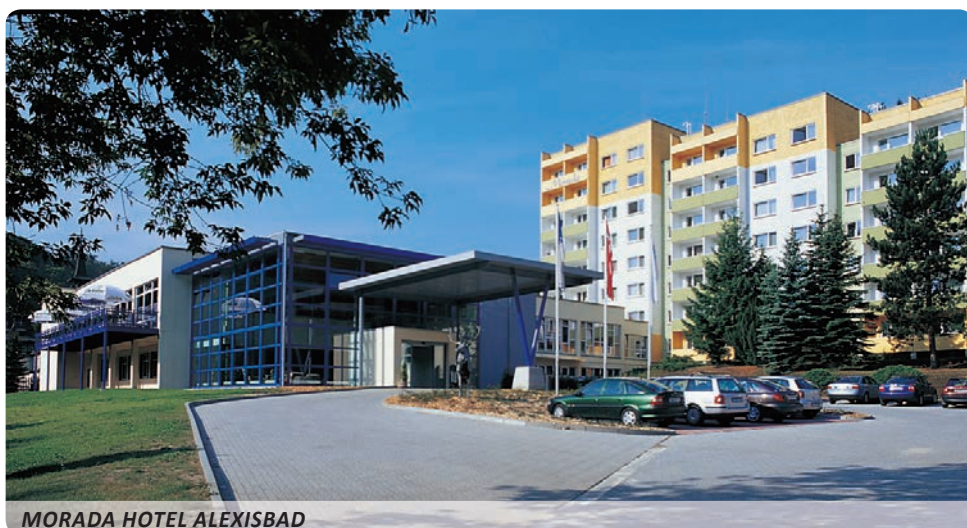
MORADA HOTEL ALEXISBAD

Für Erholung und Entspannung sorgt zudem ein Wellness- und Freizeitbereich mit Schwimmbad und Sauna , sowie ein Massage- und Kosmetikstudio .