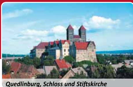
Quedlinburg, Schloss und Stiftskirche