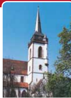
Kirche von Nordrach

Genießen Sie die Vorteile der KONUS-Gästekarte, wie z. B. die kostenlose Fahrt mit Bus und Bahn.