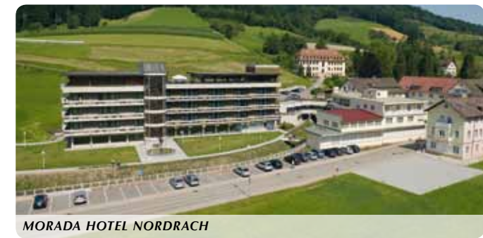
MORADA HOTEL NORDRACH

www.schwarzwald. morada.de E-Mail: nordrach@morada.de