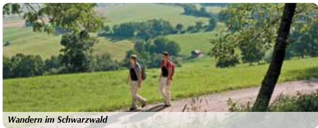
Wandern im Schwarzwald