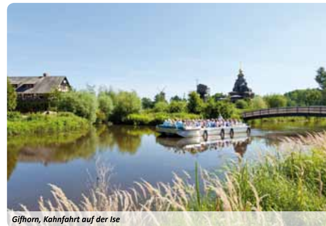
Gifhorn, Kahnfahrt auf der Ise

Das zum Hotel gehörende Traditionsrestaurant Jägerhof bietet morgens ein reichhaltiges Buffet und abends lokale und internationale Spezialitäten. Zwei Hotelbars, der Biergarten, die Sommerterrasse, das Café sowie der Wintergarten laden zum Verweilen in gemütlicher Atmosphäre ein. Darüber hinaus erwartet eine exklusive Club-Lounge die Gäste.