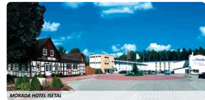
MORADA HOTEL ISETAL