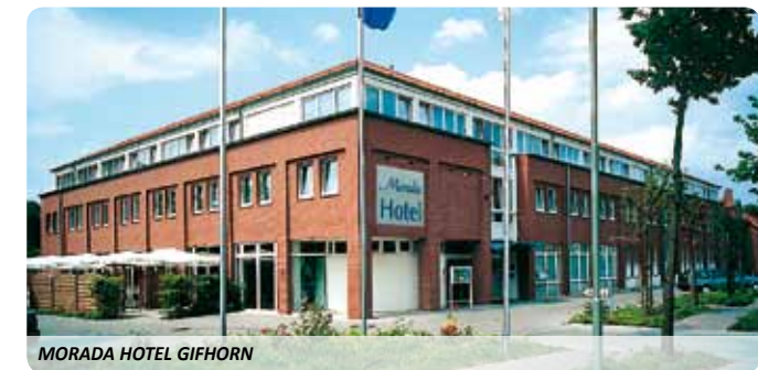
MORADA HOTEL GIFHORN