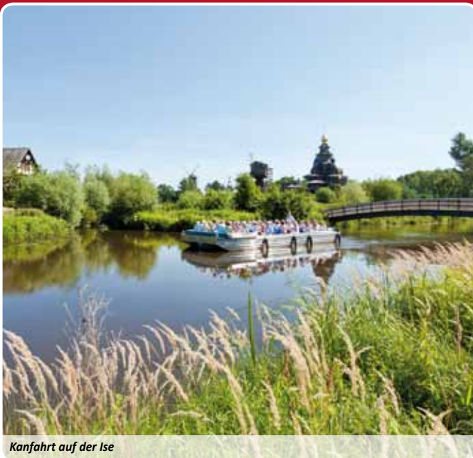
Kanfahrt auf der Ise