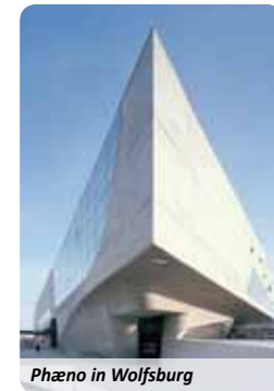
Phäno in Wolfsburg