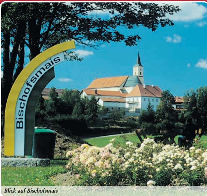
Blick auf Bischofsmais