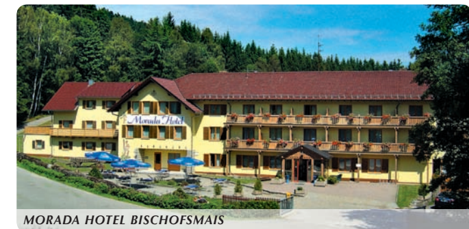
MORADA HOTEL BISCHOFSSMAIS