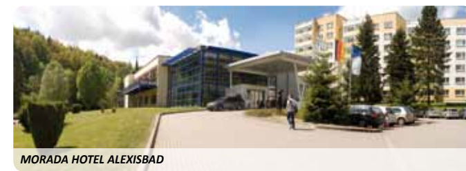
MORADA HOTEL ALEXISBAD

Drucklegung: 02/2016