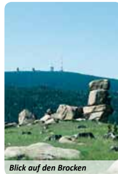
Blick auf den Brocken