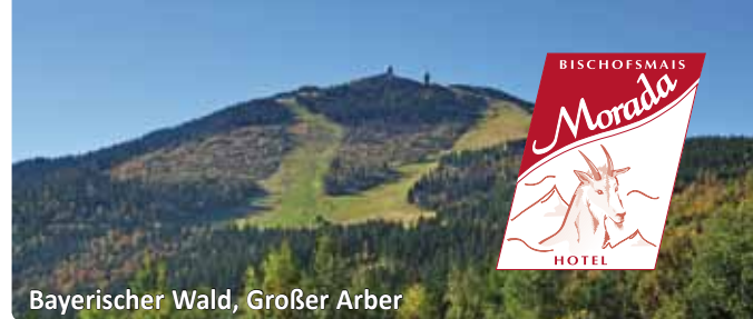
Bayerischer Wald, Großer Arber