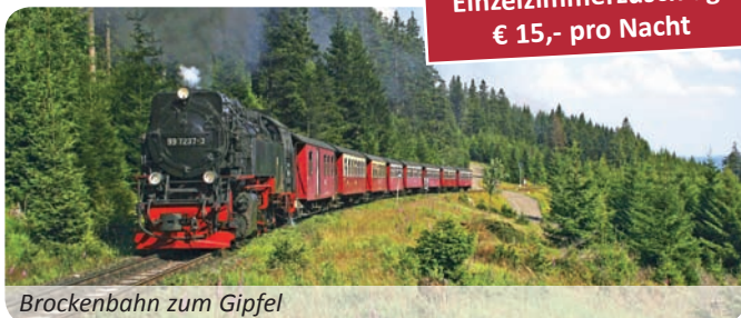
Brockenbahn zum Giffel