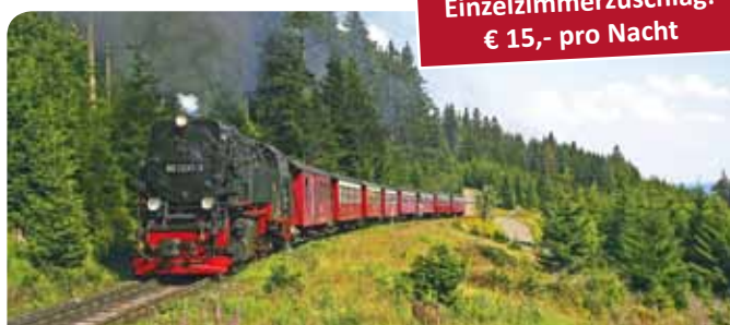
Brockenbahn zum Gipfel