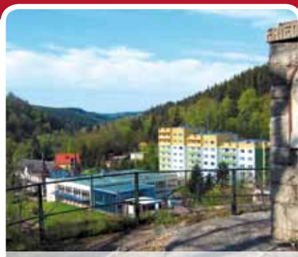
MORADA HOTEL ALEXISBAD