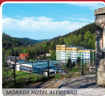
MORADA HOTEL ALEXISBAD