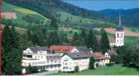
MORADA HOTEL NORDRACH